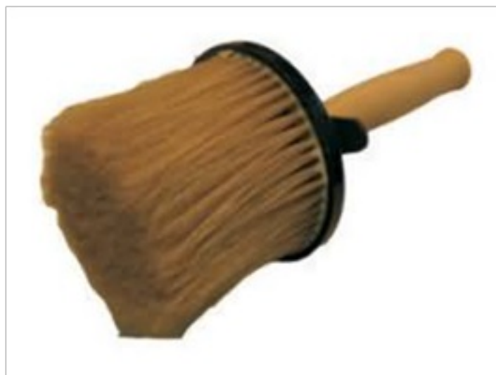
malířská štětka kulatá

Malířská štětka, kulatá nebo hranatá, (štetiny, umělé štetiny, žíně), kvalita podle použitých štetin