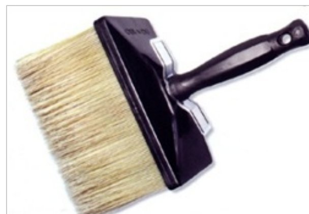
malířská štětka hranatá