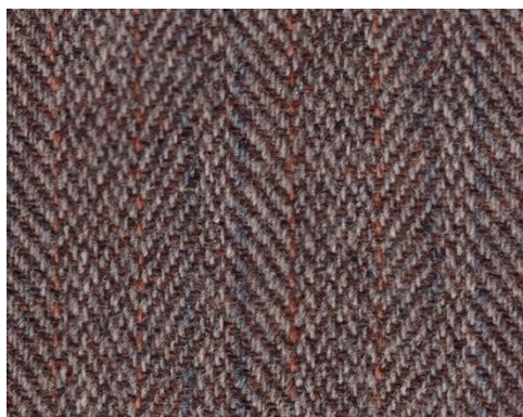
Tradiční vlněný tvíd