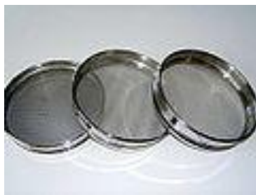
Kovové tkaniny (filtry s otvory)