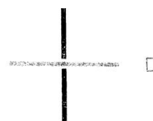
Vazný bod útkový