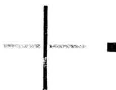
Vazný bod osnovní