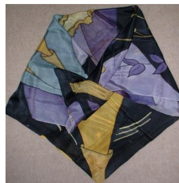
Tisk na hedvábné tkanině